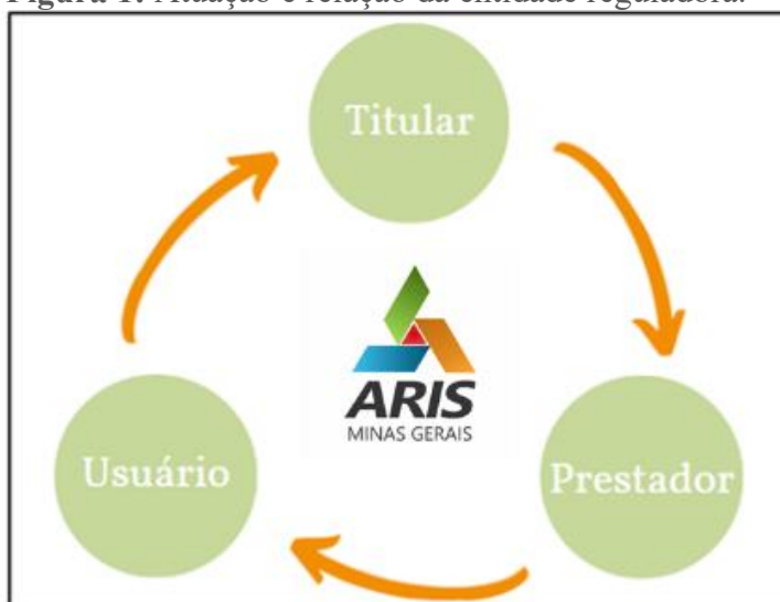
Figura 1: Atuação e relação da entidade reguladora.

Na busca pela universalização, a regulação econômica dos serviços públicos de saneamento tem como objetivo fazer com que o prestador atue sempre com a máxima eficiência, através de uma remuneração justa e adequada, e que o usuário tenha à disposição serviços de qualidade, pelo menor custo possível. Nesse contexto, a atuação da entidade reguladora envolve pelo menos três atores: o titular do serviço, o prestador de serviços e o usuário. Fica a cargo da entidade reguladora, buscar o equilíbrio de interesses entre as partes envolvidas, atentando-se ao atendimento das demandas da sociedade e garantindo a viabilidade econômica e financeira da prestação da atividade regulada. A figura 1 ilustra a atuação da entidade reguladora.